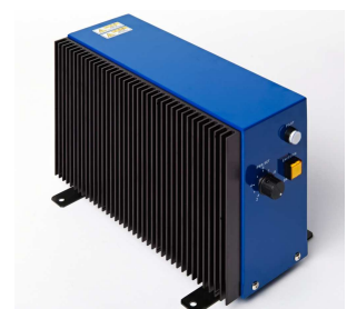
出力調整のボリューム付き